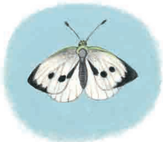
Бабочка капустная белянка, или капустница.

— Я их полью, — сказала Таня. — Только найду свою леечку. Твоя для меня слишком велика!