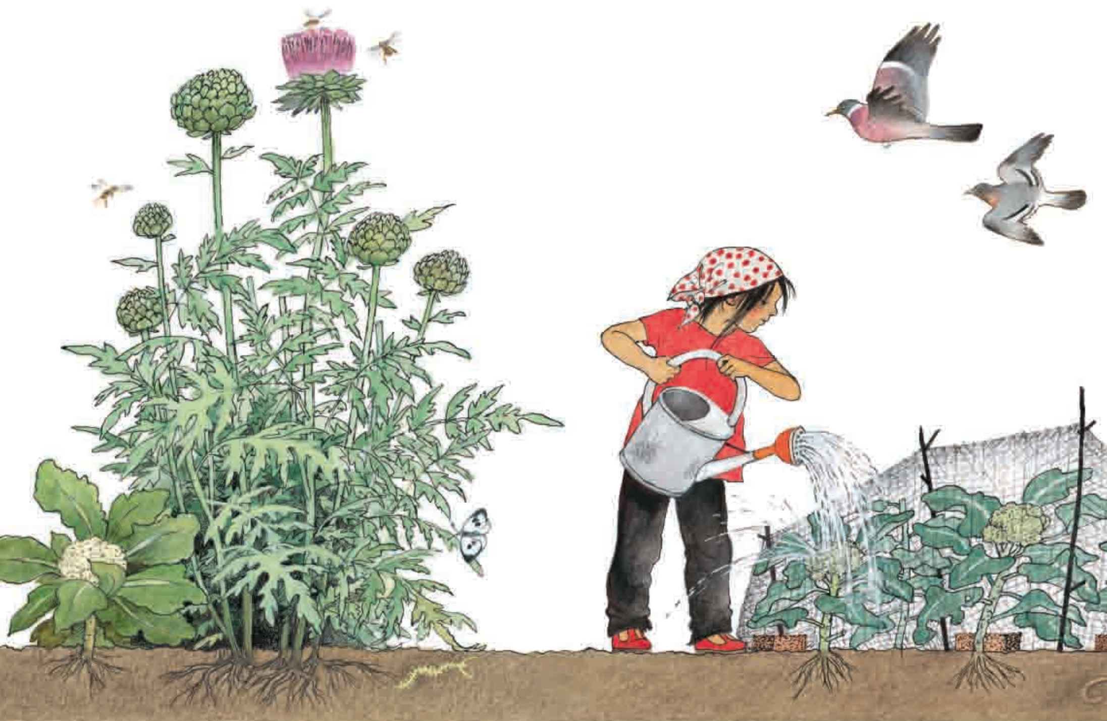
Кочан цветной капусты, лист артишока, артишок, брокколи.